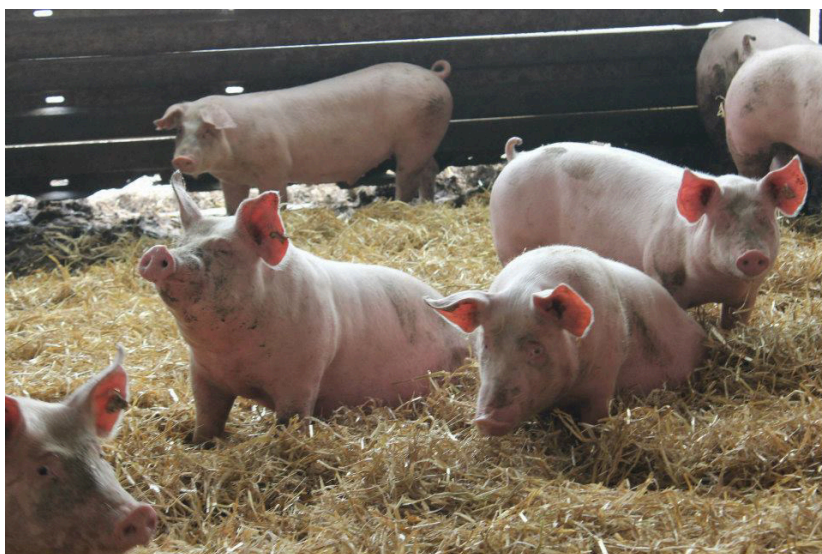
Schweine auf Stroh-Haltung – bei uns eher selten