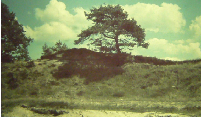
Zustand der Dammer Berge im 19. Jahrhundert, Sandheide auf einer Wanderdüne 1939