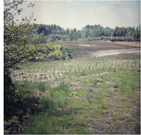
Wiederaufforstung am Mordkuhlenberg, 1963